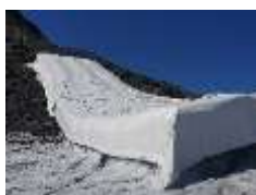
Figure 1: dépôt de neige (protection du glacier)